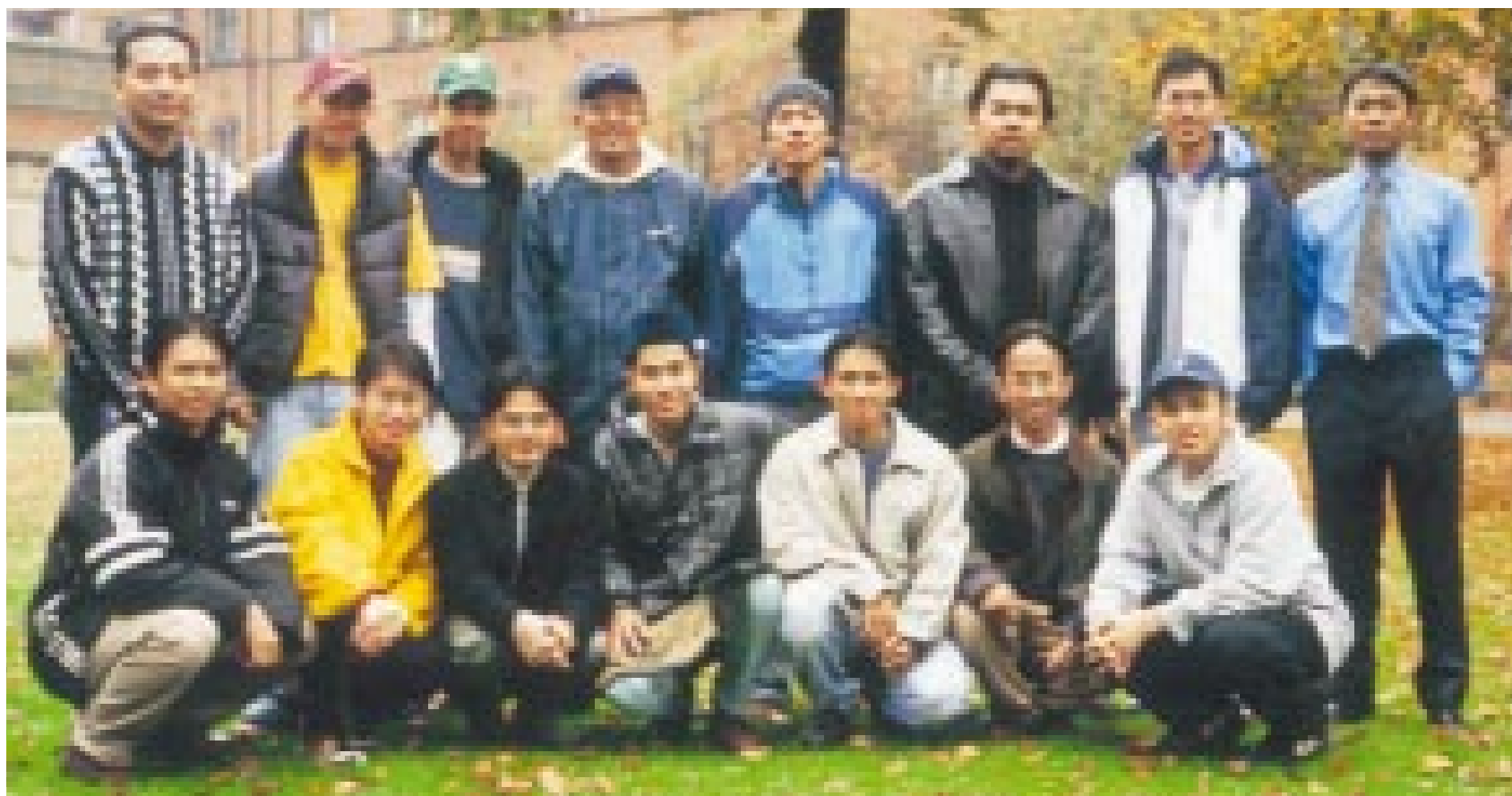
DARIPADA: Pelajar di University Of Birmingham, United Kingdom

UCAPAN: Selamat Hari Raya Aidilfitri dan Maaf Zahir Dan Batin kepada keluarga, sanak-saudara dan sahabat handai di Malaysia