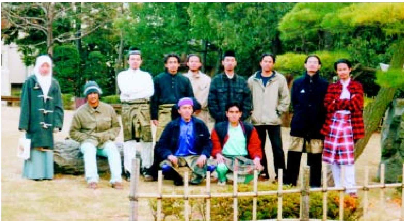
UCAPAN: Mengucapkan Selamat Hari Raya Aidilfitri dan Maaf Zahir Batin kepada keluarga, saudara mara dan sahabat handai yang mengenali diri kami. Salam Aidilfitri dari kami di Bumi Sakura.